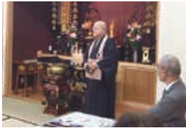
2016年10月17日 仙台市 少林寺 保春院にて