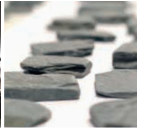
my硯ブースの様子 2018年2月16日・17日 京都マラソン受付会場「おこしやす広場」にて