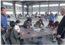
2017年4月22日 みよし市 愛知県トラック協会にて