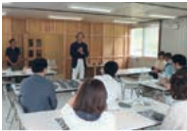
2016年7月9日 雄勝硯生産販売協同組合仮設工房にて