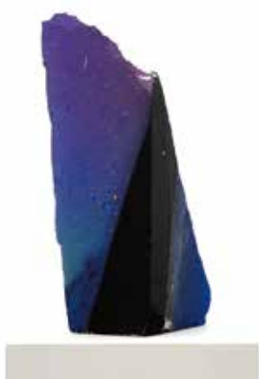
「太古の空」 イタリア大理石 / 石彩 43.5×19×17cm 2003