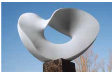
「CIRCLE WIND 2011 - 絆 -」 《東日本大震災 3.11 慰霊モニュメント 1/4 ファーストイメージモデル》 イタリア大理石 64×80×26cm 2011