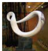
PAX2011 ジャパンソサエティ/ニューヨーク