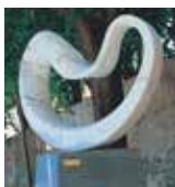
PAX2003 ピエトラサンタ/イタリア