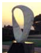
PAX2000 パチカン/イタリア