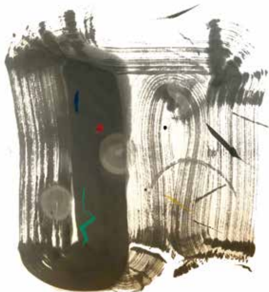
「記憶の壁」 和紙 / 墨 65×65 cm 2020