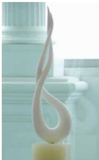
「男と女」 イタリア大理石 75×23×11cm 2009