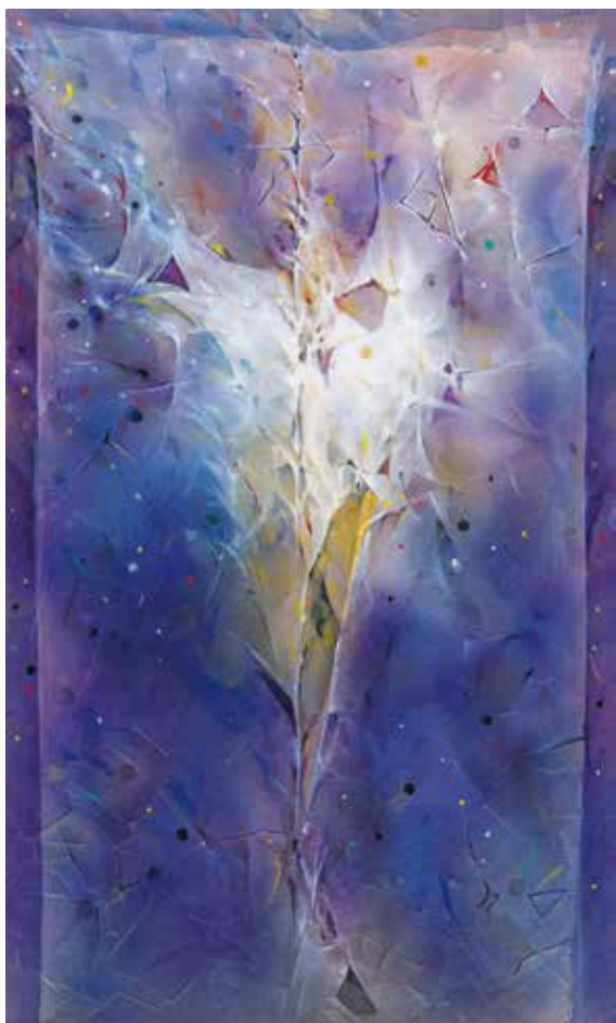
「誕生」 キャンバス / ネオフレスコ 162×97cm 2019