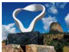
PAX2008 ワイオミング/アメリカ