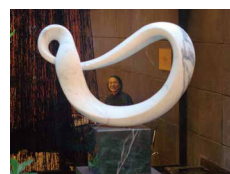
PAX2011 ジャパソサエティー/ ニューヨーク