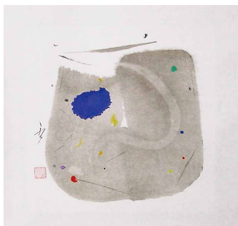
「シリーズ/記憶の壁—誕生—」 2005 和紙/墨 29×28