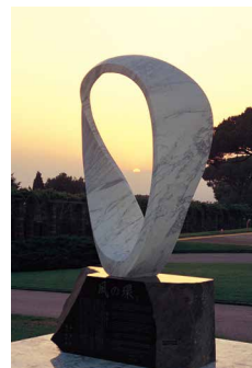
PAX2000 バチカン/イタリア

キリスト教の聖地バチカン、仏教の聖地インド・ブダガヤ、ネイティブアメリカンの聖地ワイオミング・デビルスタワー (U.S.A) などをはじめとして、世界各地に「風の環」シリーズのモニュメントを永久設置。今もその流れは世界各国にひろがりつつあります。