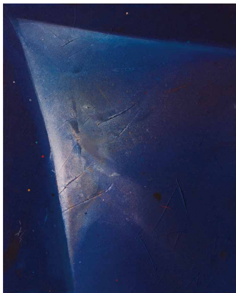
「記憶の壁」 2003 キャンパス/ネオフレスコ 50×40

イタリア産大理石、特にビアンコカラーラ、アラベスカートなどに魅せられ仕事を続けている。墨のデッサンの繰り返しで形が単純化されたものを立体化していくという作家独自の発想は大理石という自然の素材に生かされ独自の世界を作り出している。