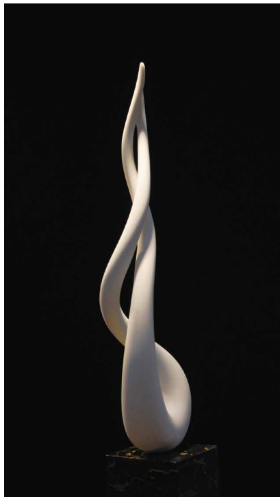
「男と女」 2006 イタリア大理石 h.77×23×11