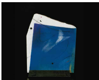
「記憶の一片」 2003 イタリア大理石/着彩 h.59×48×2

絵画におけるネオフレスコ画の確立を基に初めて可能となった技法。世界でも新しいジャンルとして注目を浴びている。「数万年地中に眠っていた生命体が大理石です」と語る武藤はその莫大な時に思いをさせ、太古の空や大地、風などを石の端辺に描き入れた「記憶のかけら」シリーズを発表、今日に至る。