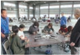
2017年4月22日 みよし市 愛知県トラック協会にて