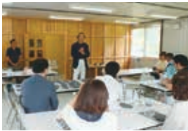
2016年7月9日 雄勝硯生産販売協同組合仮設工房にて