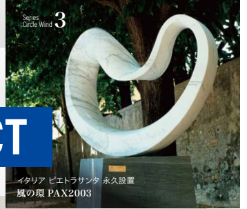
イタリア ピエトラサンタ 永久設置 風の環 PAX2003