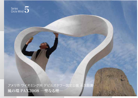
アメリカ ワイオミング州 デビルスタワー 国立公園 永久設置 風の環 PAX2008 一聖なる輝