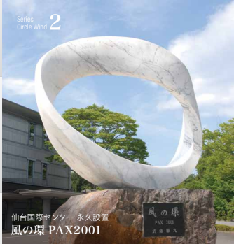
仙台国際センター 永久設置 風の環 PAX2001