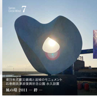
東日本大震災鎮魂と追悼のモニュメント 石巻南浜津波復興祈念公園 永久設置 風の環 2011 一絆