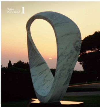
パチカン ローマ法王公邸 永久設置 風の環 PAX2000