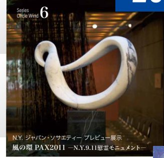
N.Y. ジャパン・ソサエティ・プレビュー展示 風の環 PAX2011 -N.Y.9.11慰霊モニュメント-