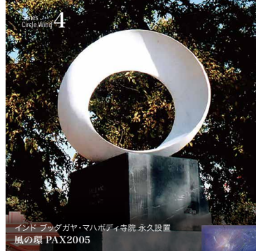
インド ブッダガヤ・マハボディ寺院 永久設置 風の環 PAX2005