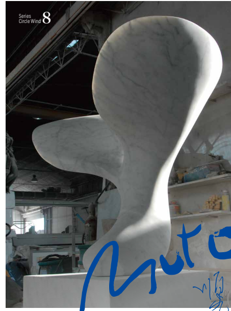
日本ペルー国交150周年記念事業 風の環 ペルー2023 "CIRCUIT WIND" -Dance of Wind- H.105×L.138×S.58cm Italian marble / Base H.60×L.100×S.80cm Italian marble